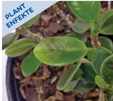
Tach fèy akòz bakteri