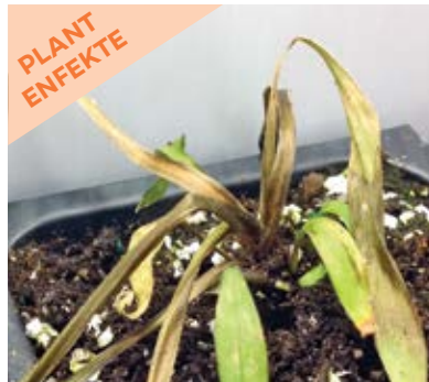
Kouwòn pouri akòz Phytophthora