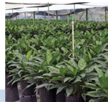
Imaj 1: Kilti fèy yo plante nan pepinyè plant dekoratif (flè) nan zòn sid Florida.