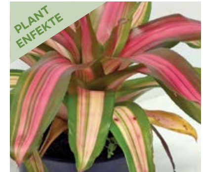
Tach nan fèy akòz alg (wouy)