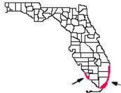
Figura 3. En Florida, el mamey puede sembrarse en todas las zonas con temperaturas cálidas (áreas rojas).

El mamey es un árbol tropical y por lo tanto no tolera las temperaturas por debajo del punto de congelación. Los árboles jóvenes son muy vulnerables al frío y sufren daños cuando las temperaturas del aire son menores de 32° F (0° C). Los árboles adultos pueden resistir temperaturas de 28° F (-2.2° C) durante varias horas sin sufrir daños mayores, pero se mueren si la temperatura descende por debajo de 22° F (-5.6° C) durante un período largo (Figura 2).