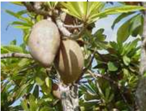
Figura 2. El fruto del mamey-sapote.

El fruto es una baya, con forma ovoidea o elipsoidea, que posee un cáliz persistente en su base (Fig. 2). Su tamaño varía entre 3 a 8 pulgadas (7.6 a 20.3 cm) de longitud en la mayoría de las variedades. La cubierta es gruesa y leñosa y de un color carmelito-rojizo. La pulpa de los frutos maduros puede ser de color