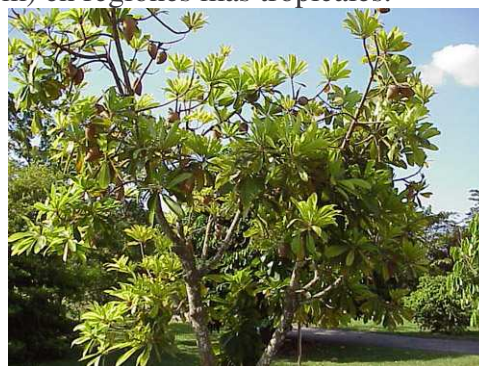
Figura 1. El árbol del mamey sapote.

El mamey es un árbol atractivo (Fig. 1) de copa abierta con un tronco central grueso y unas cuantas ramas grandes. Los árboles son grandes, erectos o con ramificaciones, y pueden alcanzar una altura de alrededor de 40 pies (12.2 m) en Florida, pero pueden sobrepasar los 60 pies (18.3 m) en regiones más tropicales.