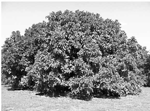
Figura 2. El árbol de aguacate.